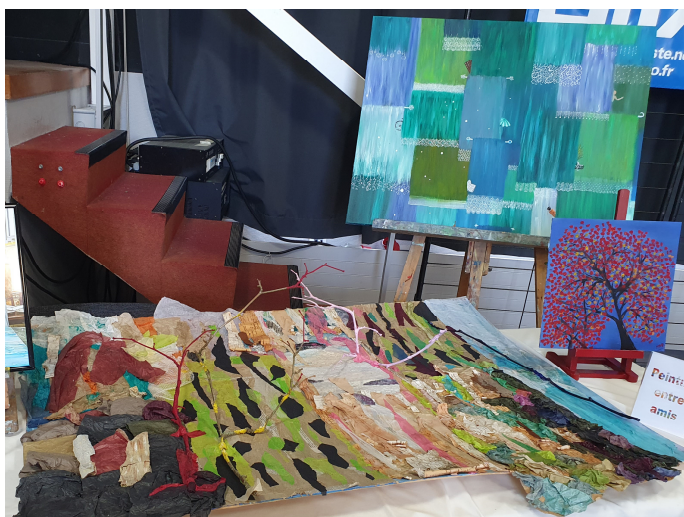
Peinture entre amis