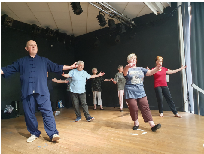
Taiji Quan , Qi Gong