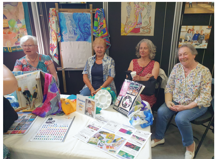
Peinture sur soie