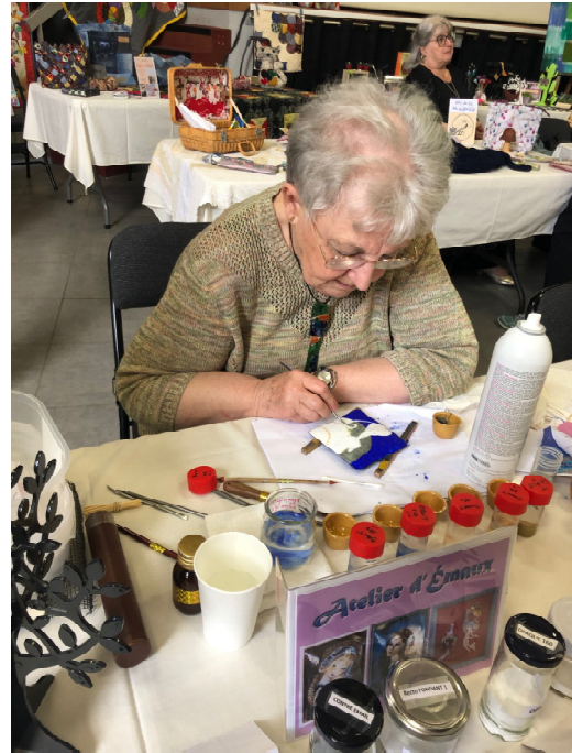
Émaux du mardi