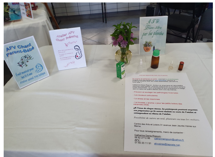
Chant parent-bébé, Chant prénatal, Bien-être par les plantes