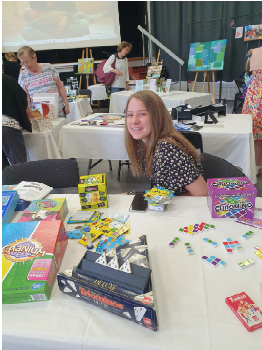
Jeux éducatifs entre copains