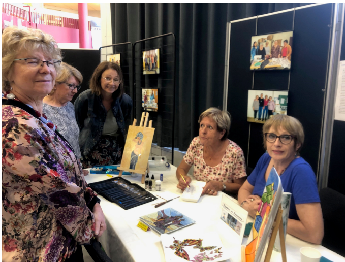
Rêverie sur porcelaine