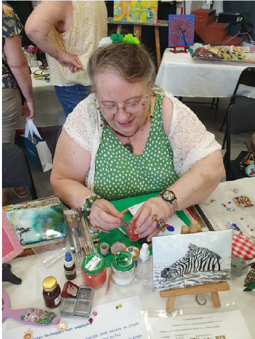
Émaux du vendredi