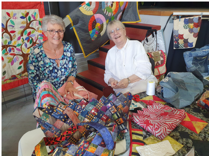
Patchwork, Coupe et couture