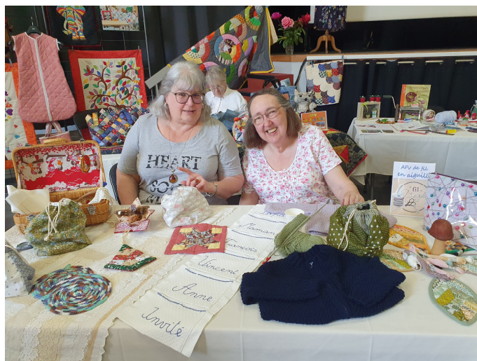
De fil en aiguilles