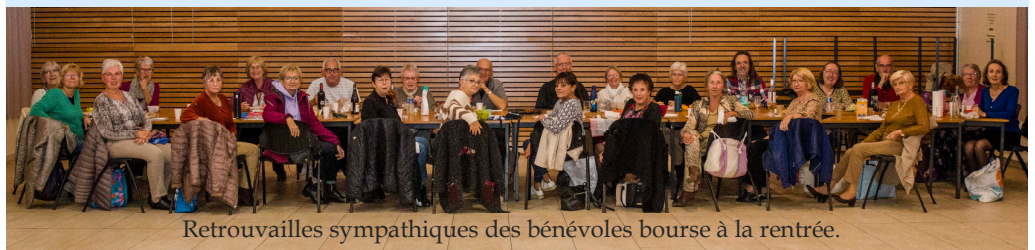
Retrouvailles sympathiques des bénévoles bourse à la rentrée.

Permanences du Bureau : au Centre des Arts et Loisirs, salle 113 de 10 h à 12 h