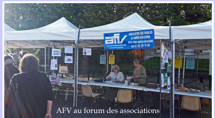
AFV au forum des associations