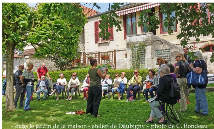
« dans le jardin de la maison - atelier de Daubigny »

Un véritable musée à ciel ouvert, voilà comment se présente le village d'Auvers-sur-Oise. Plusieurs circuits sont l'occasion d'y croiser le souvenir de Cézanne, Daumier, Corot, et bien d'autres. Mais Auvers est surtout célèbre par le séjour dramatique qu'y fit Vincent Van Gogh les 70 derniers jours de sa