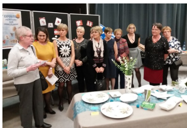
L'équipe de la peinture sur porcelaine

Et le bonheur était là aussi, et le ravissement, et l'enthousiasme, pour les visiteurs de la magnifique exposition que nous a offerte cette équipe. Dans une mise en scène exquise, dessins modernes, classiques ou naïfs, couleurs harmonieuses, contrastées ou audacieuses, pas une pièce n'aurait déparé dans une exposition Haviland ou Bernardaud. Bravo à toutes ces artistes dignes des plus grands.