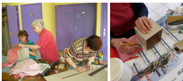
Carton et Cartoline

Merci de vous occuper de nous avec autant de passion que nous avons éprouvée à être fabriquées.