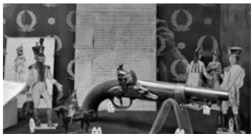
La Garde Républicaine