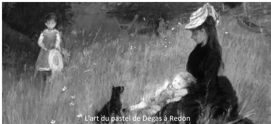
L'art du pastel de Degas à Redon