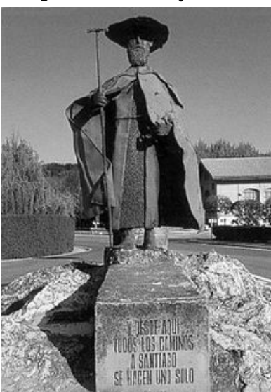
Pèlerin à l'entrée de Puente la Reina marquant la jonction des routes de France et d'Espagne.

J'ai réalisé ce voyage en deux parties, la première en septembre 2012, de Paris à Pampelune, nous devions être trois, je me retrouvai seul, un projet est un projet et je décidai d'y aller. En fait ce fut 7 jours d'enchantement, le vélo chargé de sacoches, j'allai d'abbaye en collégiale, par des