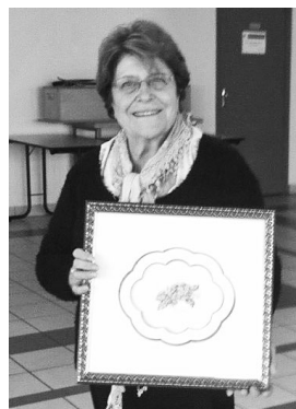
La gagnante du lot

On n'a pas tous les jours 20 ans mais vivement l'exposition de l'année prochaine, nous y travaillons déjà tous activement !!!!!