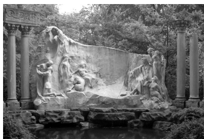
La Vallée suisse Chantilly Aquarelle de Marie Laurencin