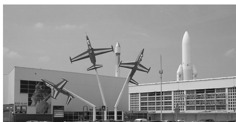
Musée de l'air et de l'espace Van Gogh et le japonisme L'école des beaux-arts