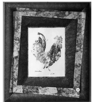
Les 3 cadres choisis par le public