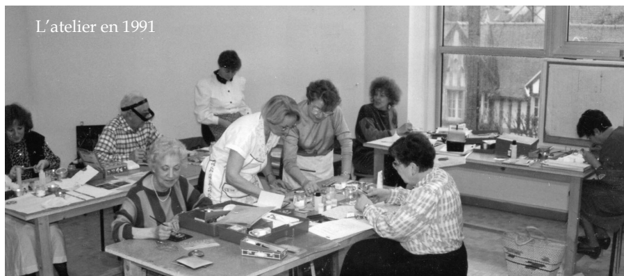
L'atelier en 1991