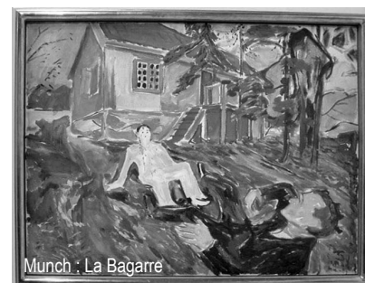
Munch : La Bagarre