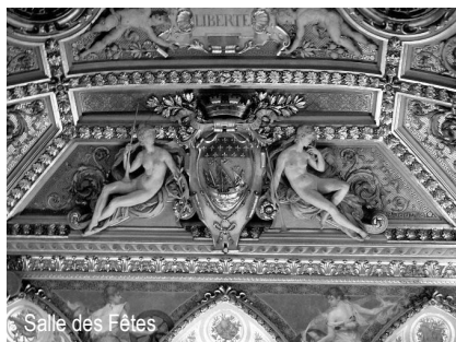
Salle des Fêtes