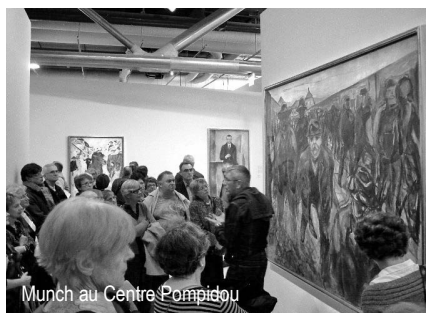
Munch au Centre Pompidou

Tout d'abord, le 18, l'exposition que le Centre Pompidou consacre (jusqu'au 9 janvier) au peintre norvégien Edvard Munch a attiré deux groupes d'une vingtaine de membres de notre association. « Le Cri » reste le tableau le plus connu de Munch. Mais peinte en 1893, cette toile ne trouvait pas sa place dans une exposition qui s'intéresse aux années postérieures à 1900, où l'artiste réalisait la plus grande part de son œuvre, avant sa disparition en 1944. Munch n'est certes pas un peintre « léger » mais angoissé, tourmenté par la maladie, la mort. Sa peinture constitue l'exact reflet de cet état d'esprit et en fait un peintre unique, d'une grande modernité. On sort de l'exposition profondément frappé.