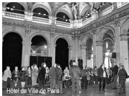
Hôtel de Ville de Paris

A deux pas du Centre Pompidou, l'Hôtel de ville de Paris. Changement de décor. Escaliers majestueux, salons somptueux avec vue sur la Seine... Une quarantaine de Vairois se sont retrouvés sous les ors de ses plafonds le 25 novembre.