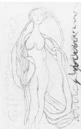
LOUISE BOURGEOIS - MOI, EUGENIE GRANDET