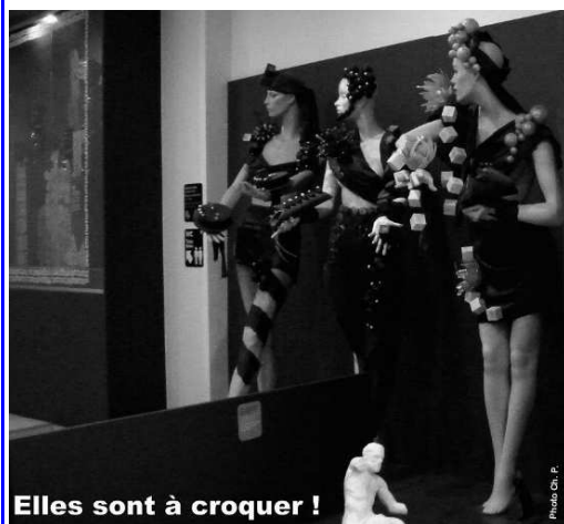
Elles sont à croquer !